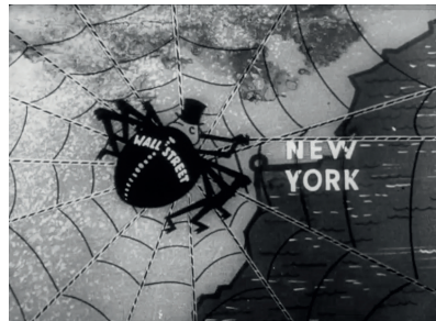
ZÁBĚR Z FILMU BĚDA TOMU, SKRZE NĚHOŽ PŘÍCHÁZÍ POHORŠENÍ

Historie 1950 vznikla jako případová studie (didaktická detektivka), která umožňuje učitelům, aby v jedné hodině komplexně naplnili vzdělávací cíle kurikula v oblasti dovedností. Směřuje za hranice znalostního dějepisu, který se zaměřuje na osvojování faktů. Historie 1950 usiluje o rozvoj historické gramotnosti. Žáci si nad historií kladou otázky, užívají znalosti k hlubším poznávacím cílům, aktivně se podílejí na utváření smyslu historie a reflektují možné významy minulosti pro současnost.